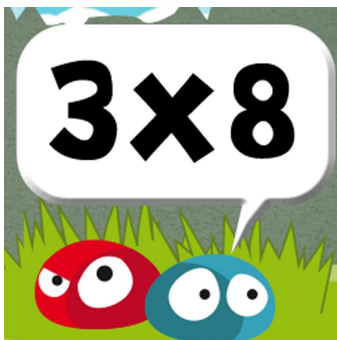
Tafels trainen Full