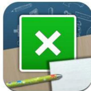
Tafels oefenen HD