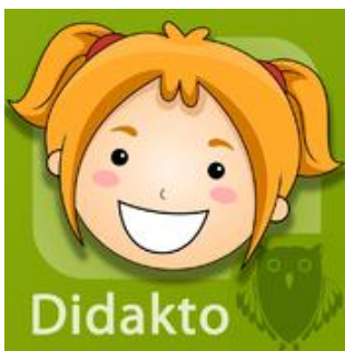
Didakto tafels HD

Opgelet! Wij werken met iPads en weten dus niet of deze beschikbaar zijn voor andere tablets)